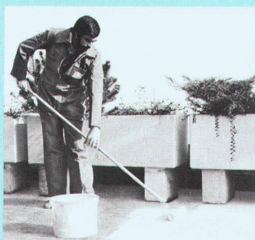
Résiste aux intempéries et aux mouvements.