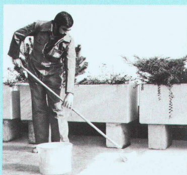
Résiste aux intempéries et aux mouvements.