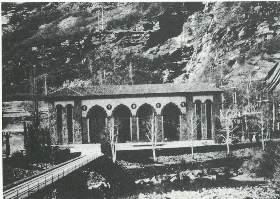
Centrale del Piottina, Lavorgo.

zera) ben presto il consumo cantonale avrebbe raggiunto la produzione con gli impianti di allora.