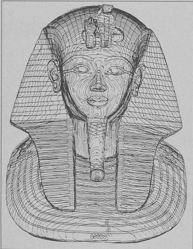
1) Le plan photogrammétrique ne donne pas seulement l'indication des surfaces en deux dimensions, il contient aussi des courbes de niveau très fines qui indiquent la troisième dimension comme dans une carte topographique — l'équidistance est de 1 mm. La restitution a été faite dans l'autographe Wild A10.

Ce travail a été exécuté à Toronto; les masques aux dimensions gigantesques — leur hauteur est de 2,90 m, alors que l'original présente la grandeur exacte d'un visage humain, soit 54 cm — ont été exposés devant le musée pour attirer l'attention des passants et les inciter à visiter l'exposition des trésors de Toutankhamon.