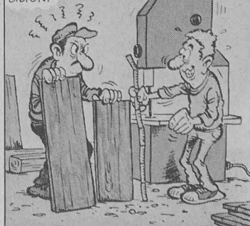
Extrait de la documentation Un métier... un avenir (menuisier).

L'EMPLOI D'OUTILLAGE DE PLUS EN PLUS RAPIDE ET MODERNE EXIGE DE LA PRÉCISION.