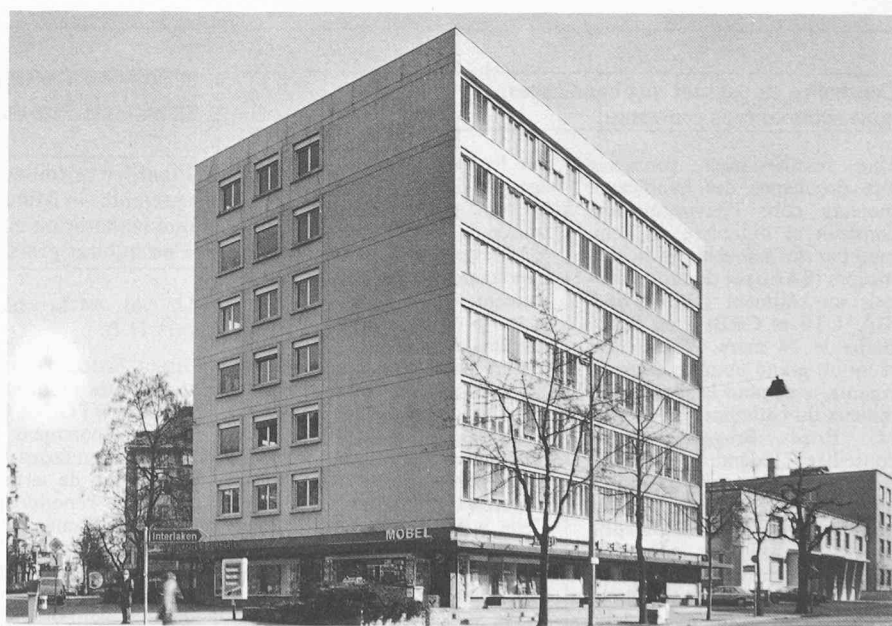
Economie d'énergie grâce au chauffage au gaz : bâtiment PTT à la place Victoria à Berne.

L'immeuble sis à la place Victoria à Berne, dans lequel est logée l'administration des services automobiles des PTT, a consommé quelque 3,3 millions de TJ de mazout par an entre 1977 et 1980, même 4,1 millions de TJ, en 1973-74. L'installation de chauffage à réglage manuel se composait de deux chaudières en fonte Sulzer IV d'une puissance totale de 700 kW, à brûleurs à mazout à petite vitesse (1400 t/min.), datant de 1960. Il a fallu enlever des carreaux, afin d'optimiser les fumées quant à la suie; la température des fumées était de 280 °C environ. Tous les matins à 5 heures, le concierge descendait à la chaufferie pour arrêter la baisse de tem-