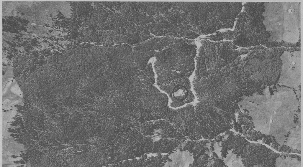
Développement d'un reboisement: reboisement «Glunggmoos», région du Lac Noir (FR).