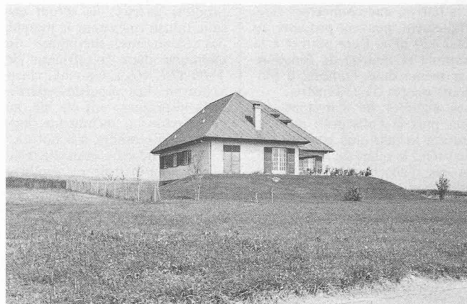
Fig. 9. — Sullens: Une certaine idée du prestige. (On s'étonnera en passant de la mansuétude de certaines communes par ailleurs soucieuses de « chasser la petite bête ». Réd.)

processus d'urbanisation. Les habitants périurbains viennent principalement des villes et du logement collectif. Leurs comportements pourraient même être qualifiés d'ultra-urbains: motorisation ou bimotorisation, recours à l'hypermarché et au congélateur, problèmes relationnels avec les anciens habitants en sont autant de manifestations. » La rurbanisation est donc véritablement un phénomène urbain. Toutefois la nature socio-économique de celui-ci est en complète rupture avec l'évolution traditionnelle de la ville latine. Cette rupture peut se lire au travers de la nouvelle organisation spatiale ainsi engendrée. En effet, tout indique que les espaces libres interstitiels entre les communes rurales et les agglomérations resteront des espaces exclusivement voués à l'agriculture. Cinquante ans d'efforts en matière d'aménagement du territoire permettent de penser que les acquis en matière de protection des zones agricoles resteront solidement ancrés dans les objectifs des générations à venir.