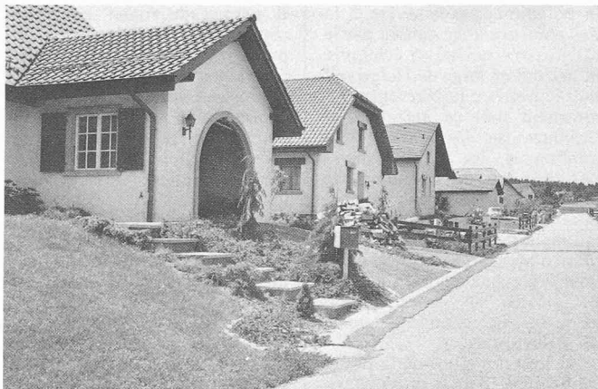
Fig. 8. — Savigny: On retrouve dans certaines zones de villas des éléments formels et d'organisation propres aux banlieues de certaines villes de l'ouest américain.