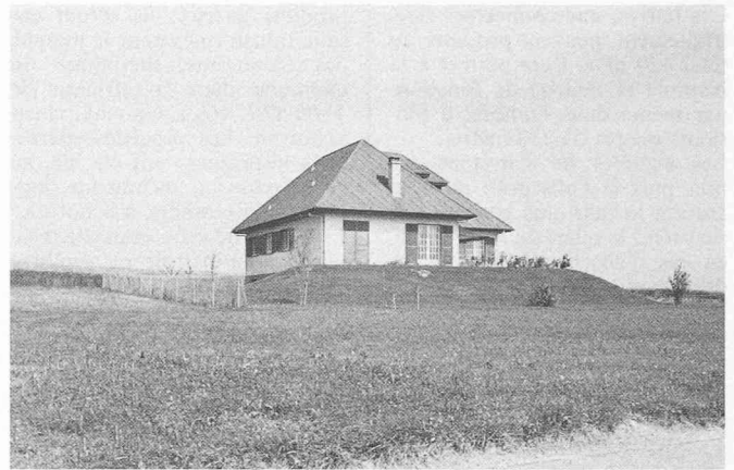
Fig. 9. — Sullens: Une certaine idée du prestige. (On s'étonnera en passant de la mansuétude de certaines communes par ailleurs soucieuses de « chasser la petite bête ». Réd.)

processus d'urbanisation. Les habitants périurbains viennent principalement des villes et du logement collectif. Leurs comportements pourraient même être qualifiés d'ultra-urbains: motorisation ou bimotorisation, recours à l'hypermarché et au congélateur, problèmes relationnels avec les anciens habitants en sont autant de manifestations. » La rurbanisation est donc véritablement un phénomène urbain. Toutefois la nature socio-économique de celui-ci est en complète rupture avec l'évolution traditionnelle de la ville latine. Cette rupture peut se lire au travers de la nouvelle organisation spatiale ainsi engendrée. En effet, tout indique que les espaces libres interstitiels entre les communes rurales et les agglomérations resteront des espaces exclusivement voués à l'agriculture. Cinquante ans d'efforts en matière d'aménagement du territoire permettent de penser que les acquis en matière de protection des zones agricoles resteront solidement ancrés dans les objectifs des générations à venir.