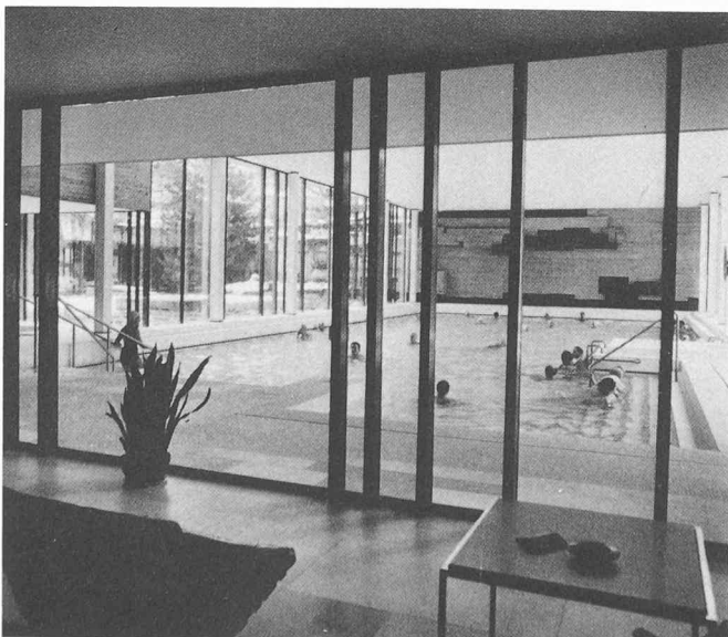
← Piscine thermale.

A Baden s'est établi également le siège principal de grandes entreprises d'élec-