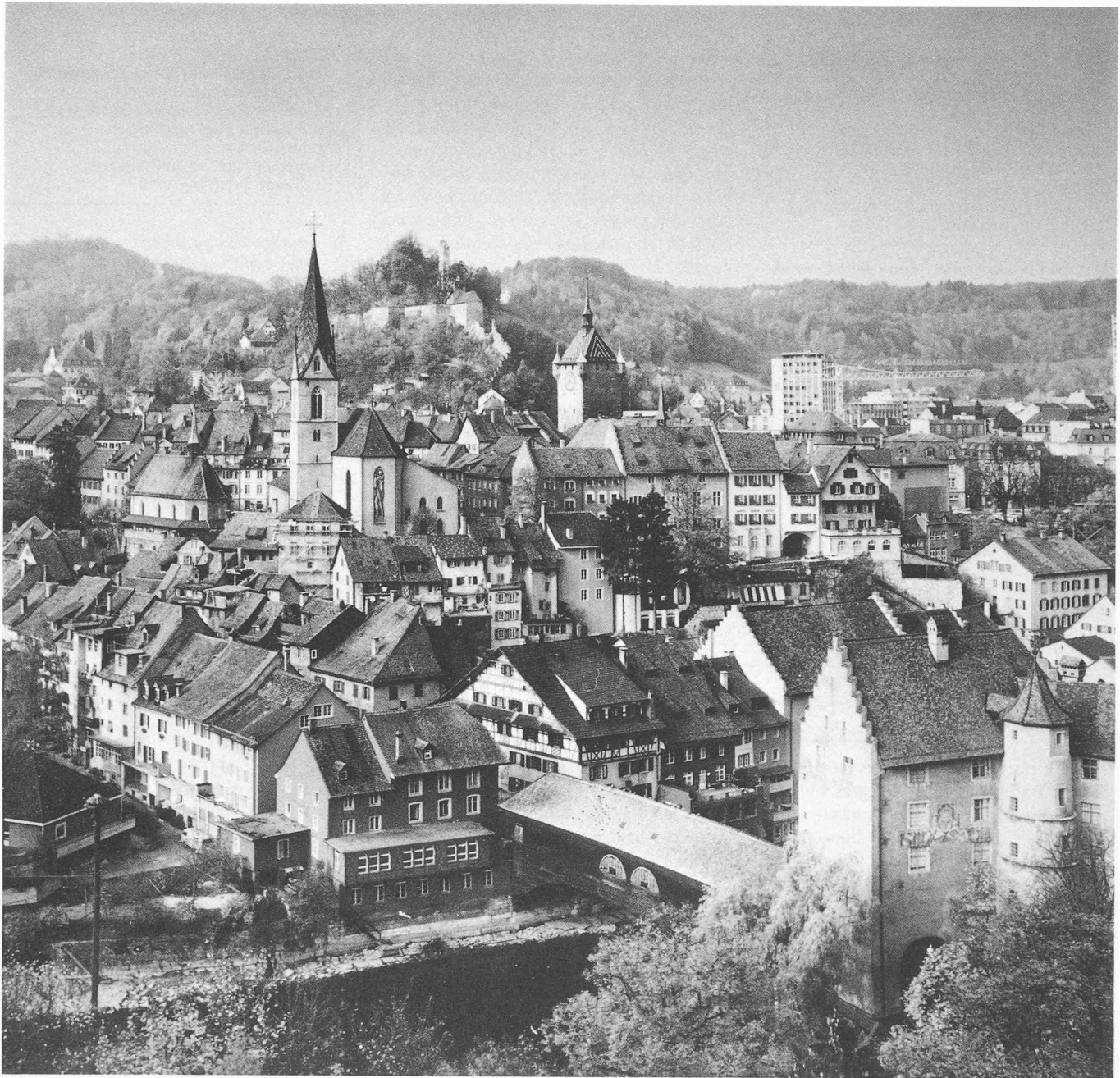
Vue sur la vieille ville de Baden.

puis la construction de son Kursaal, il y a plus d'un siècle, en 1874, que Baden est un lieu de rencontre dans l'acception actuelle du terme.