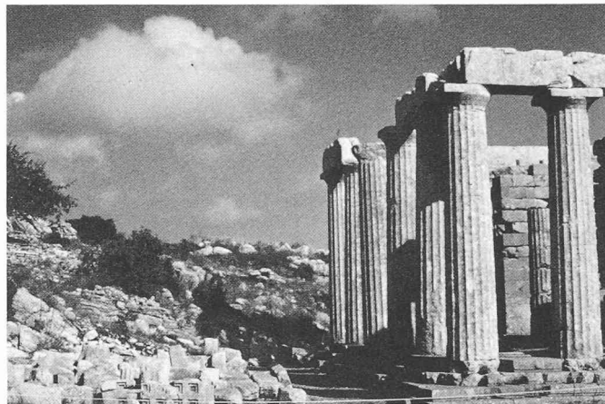
Retour aux sources de l'harmonie (Temple d'Apollon Epicourios à Bassae).

On nous permettra de relever encore un autre aspect parmi les activités qui ont fait de l'architecte Von der Mühl l'un de ces humanistes si rares de nos jours: il a présidé durant de nombreuses an-