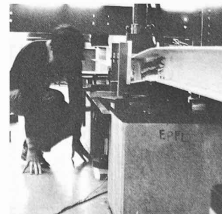
Détermination de la résistance d'une poutre métallique par un essai de charge jusqu'à la rupture, soit environ 30 tonnes.