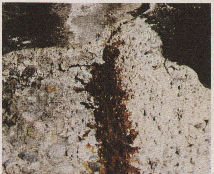
Pont C. — L'acier de diamètre 30 mm s'est entièrement transformé en oxyde de fer !