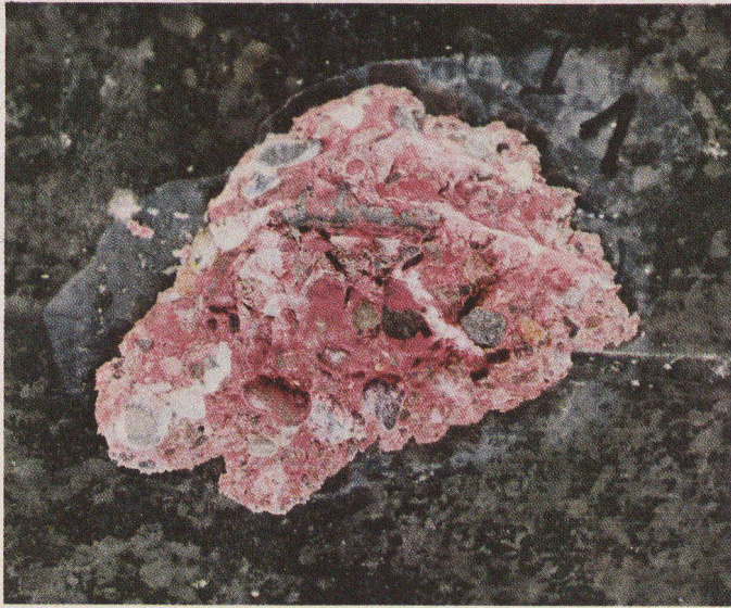
Pont A. — Aucune trace de carbonatation à l'âge de 42 ans ! La liaison béton-acier est parfaite.