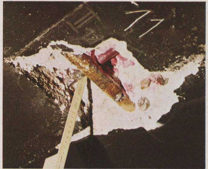
Pont C. — La différence d'aspect du fer de répartition dans la zone carbonatée (gauche) et la zone alcaline (droite) est significative. Dans quelques années, l'oxydation du fer portant fera éclater sa couverture en béton.