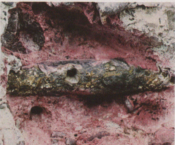
Pont C. — Le tiers inférieur de cet acier est atteint par la carbonatation et l'oxydation l'a déjà désolidarisé de sa couverture de béton.