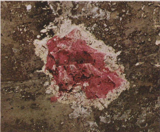
Pont B. — Le béton alcalin enrobe encore entièrement cet acier comme en témoigne sa coloration rouge.