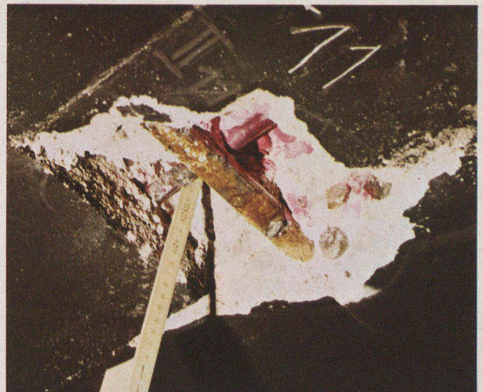
Pont C. — La différence d'aspect du fer de répartition dans la zone carbonatée (gauche) et la zone alcaline (droite) est significative. Dans quelques années, l'oxydation du fer portant fera éclater sa couverture en béton.