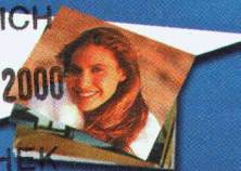
Photo 10x15 cm: Fr. -.55 Photo 20x30 cm: Fr. 4.40 Formats VGA disponibles Frais de port: Fr. 3.90