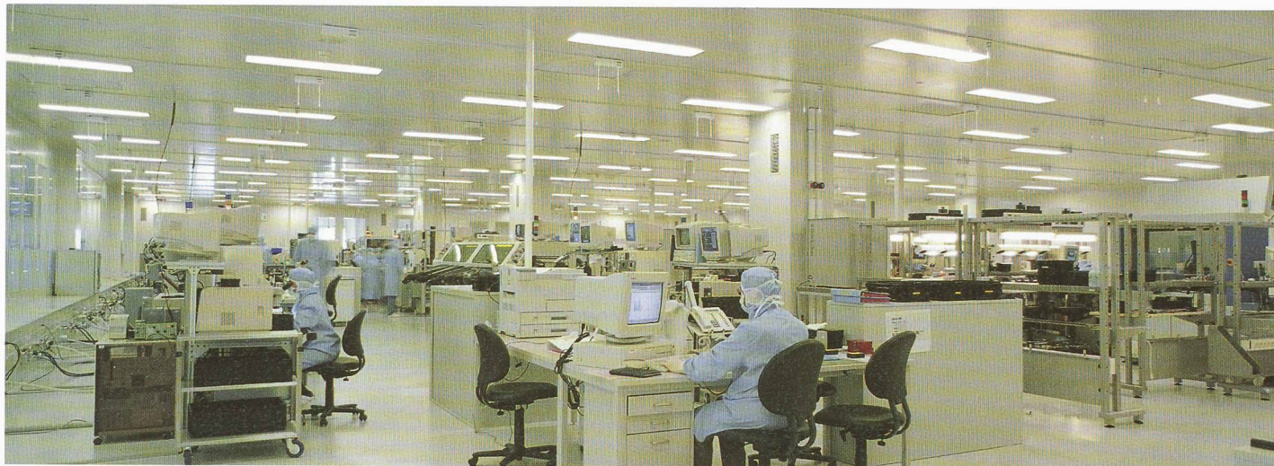
La salle blanche répond, en phase de production, à une classe de propreté 100000 (10000 pour une zone restreinte)