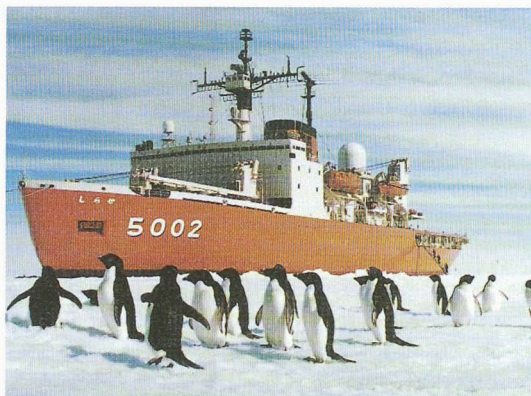
Les passagers des navires de croisière ne sont pas seuls à bénéficier du confort de la technique de transport vertical. Le « Shirase », navire de recherche polaire, est équipé de deux monte-charge de 4 t desservant trois ponts.

niers des conditions bien plus sévères qu'à terre. C'est ainsi qu'ils doivent fonctionner par une inclinaison permanente de 15°, par 10° de tangage et 22,5° de roulis. Ils ont également à supporter des accélérations verticales de 0,8 g et horizontales de 0,5 g dans toutes les directions. La résistance exigée aux intempéries conduit notamment à utiliser de façon extensive l'acier inoxydable et à installer des canalisations appropriées à l'évacuation de l'eau. Les dénivellations desservies peuvent atteindre jusqu'à 23 m, la largeur des marches 100 cm. Combinées à une pente se situant entre 27 et 35°, ces caractéristiques