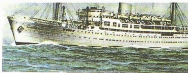
PAKETBOOT BAUDOUINVILLE der COMPAGNIE MARITIME BELGE, ausgerüstet mit 4 elektrischen SCHINDLER-AUFZÜGEN mit Metall-Kabinen- und Schachttüren. Ansicht vom Passager-Aufzug auf Brück

En effet, ces nouvelles unités ont été conçues spécifiquement pour cette branche particulière du tourisme mondial qu'est la croisière. Jadis réservée à une élite fortunée, cette dernière est dorénavant accessible à de larges couches de population des pays industrialisés. Elle conserve certes son image de luxe, mais si l'on définit le luxe comme un privilège réservé à des happy few , on ne peut plus le considérer aujourd'hui de la même manière. Quand 2000 ou 3000 passagers se partagent la même classe d'un navire une quinzaine durant, comment parler d'exclusivité ?