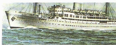
PAKETBOOT "BAUDOUINVILLE" der COMPAGNIE MARITIME BELGE, ausgerüstet mit 4 elektrischen SCHINDLER-AUFZÜGEN mit Metall-Kabinen und Schächtförmern. Ansicht vom Passager-Aufzug auf Brücke

En effet, ces nouvelles unités ont été conçues spécifiquement pour cette branche particulière du tourisme mondial qu'est la croisière. Jadis réservée à une élite fortunée, cette dernière est dorénavant accessible à de larges couches de population des pays industrialisés. Elle conserve certes son image de luxe, mais si l'on définit le luxe comme un privilège réservé à des happy few , on ne peut plus le considérer aujourd'hui de la même manière. Quand 2000 ou 3000 passagers se partagent la même classe d'un navire une quinzaine durant, comment parler d'exclusivité ?