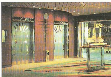
Les autres ascenseurs pour passagers du « Legend of the Seas » contribuent également à son image de luxe.

assurés pour une inclinaison permanente de 15° et un roulis de 30°. Leur sécurité contre l'incendie doit être garantie de façon à empêcher la propagation des flammes d'un pont à l'autre pendant 60 minutes. La puissance installée doit tenir compte des accélérations supplémentaires dues aux mouvements du navire.