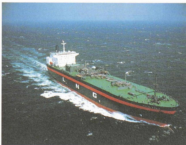
Le « Polar Eagle »: des ascenseurs de service capables d'affronter 11 Beaufort sur la route Japon-Alaska

Même si le domaine de la croisière est celui qui promet le plus grand développement ces prochaines années, il existe d'autres domaines d'application du savoir-faire acquis par Schindler Marine . Les navires marchands sont l'objet d'une rationalisation poussée, en vue de réduire leurs coûts d'exploitation. Cela signifie que les équipages sont de moins en moins nombreux et doivent donc travailler de la façon la plus rationnelle et ergonomique possible.