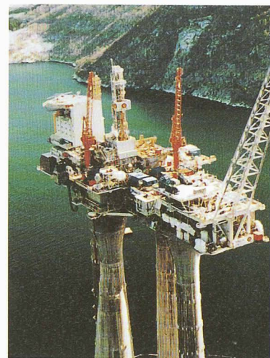
La plate-forme Troll