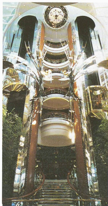
Les ascenseurs panoramiques du « Legend of the Seas » : éléments marquants d'un atrium qui s'étend sur neuf niveaux

Ce dernier point est important, étant donné l'environnement où ils doivent fonctionner ; en effet, même les plus grands navires sont soumis à des mouvements entraînant pour les ascenseurs des charges que ne connaissent pas leurs homologues terrestres. Leur fonction et leur confort doivent être