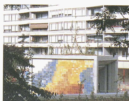
Les portails d'accès de la tranchée couverte des Palettes, de forme cubique, offrent une protection contre le bruit. Les plans inclinés qui les prolongent sont aménagés en «jardins suspendus» alors que leurs faces latérales sont revêtues d'émaux de grès colorés avec des terres naturelles. Chaque accès a une couleur dominante.