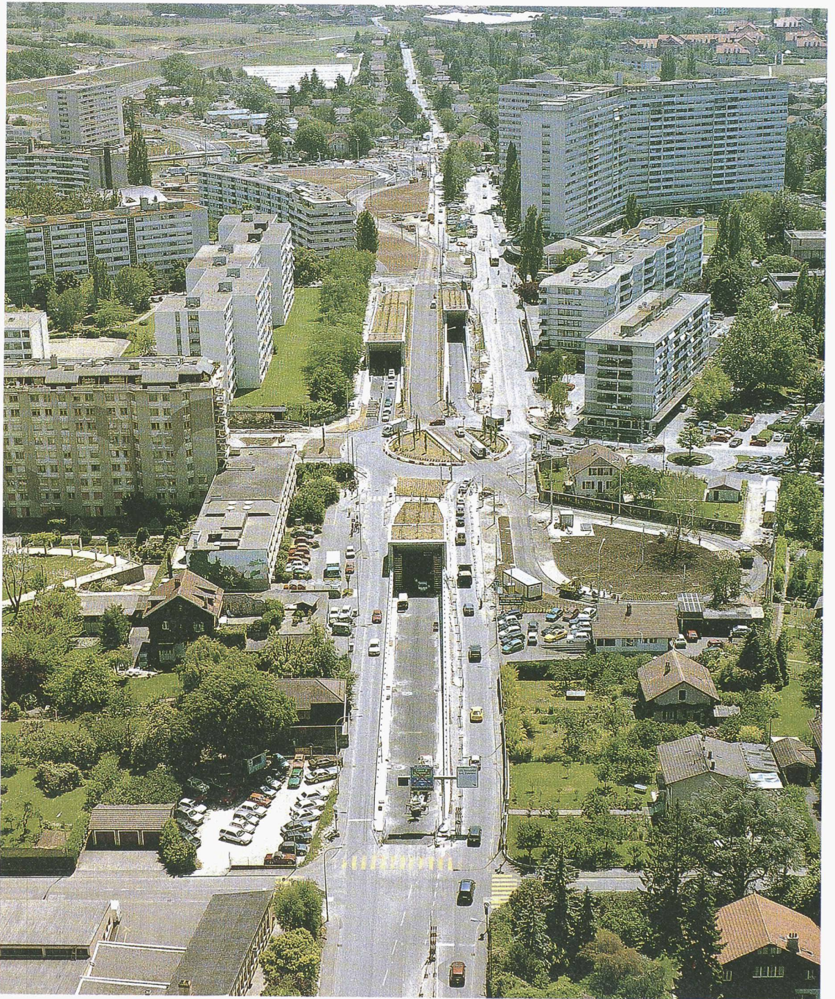
Implantée dans un quartier de forte densité, la tranchée couverte des Palettes permet de restituer la surface au trafic local alors que ses différentes bretelles d'accès lui permettent de s'intégrer dans le réseau dense des circulations.