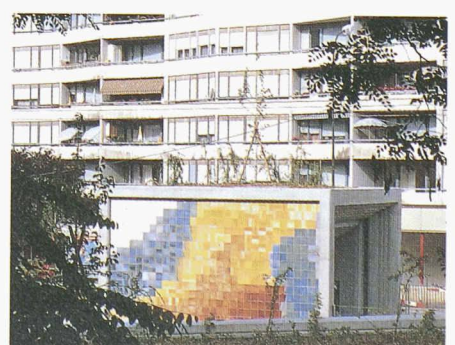
Les portails d'accès de la tranchée couverte des Palettes, de forme cubique, offrent une protection contre le bruit. Les plans inclinés qui les prolongent sont aménagés en «jardins suspendus» alors que leurs faces latérales sont revêtues d'émaux de grès colorés avec des terres naturelles. Chaque accès a une couleur dominante.