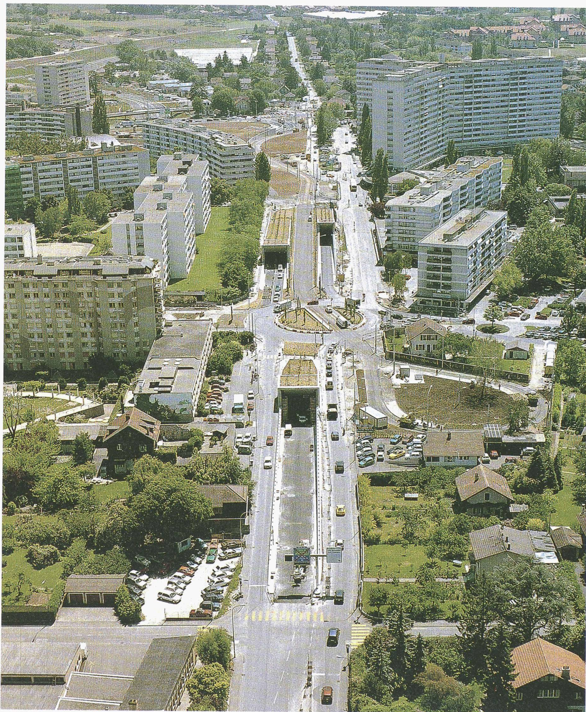
Implantée dans un quartier de forte densité, la tranchée couverte des Palettes permet de restituer la surface au trafic local alors que ses différentes bretelles d'accès lui permettent de s'intégrer dans le réseau dense des circulations.