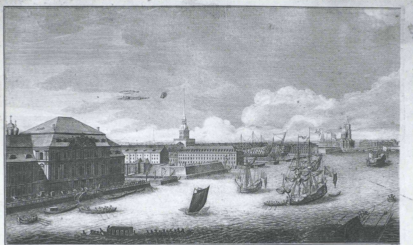
Проспектъ въ низъ по Невѣ рѣкѣ между зимнимъ Ея Императорскаго Величества домомъ и Академіею Наукъ

Vue de la Néva, entre le Palais d'Hiver et l'Académie des sciences, 1750 1751. Eau-forte, 50 x 141 cm, Archives historiques d'Etat russes