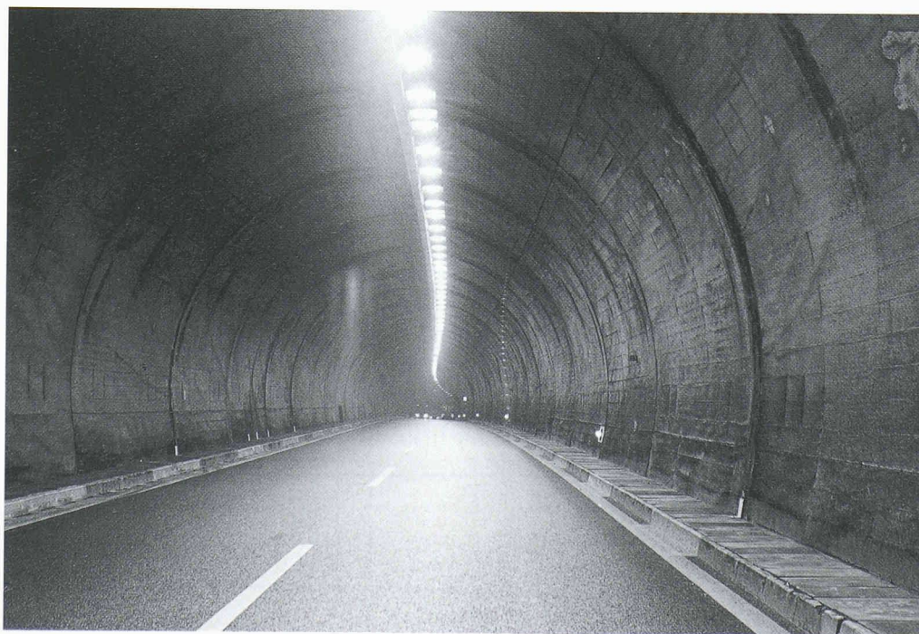
Fig. 1. - Eclairage du tunnel du Flonzaley