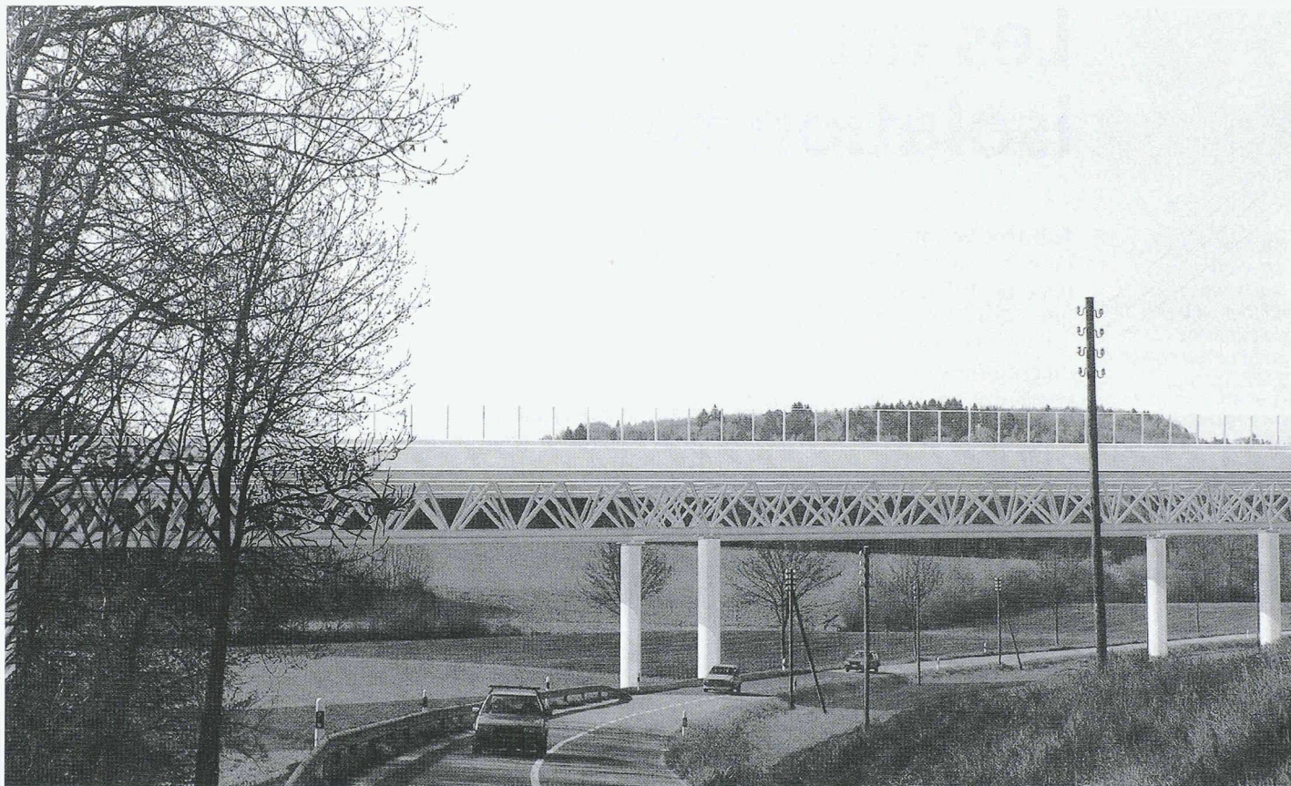
Viaduc de Lully/FR: projet du groupement III