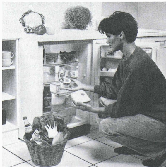
Réfrigérateur KTR 1570 totalement exempt de CFC et de HFC, il se distingue en outre par sa consommation extrêmement réduite. Avec un volume utile de 142 litres, il ne consomme que 0,34 kWh (par 100 litres).

Robert Bosch SA, vente électro-ménager Hohlstrasse 188, 8021 Zurich tél. 01/247 63 04, fax 01/247 63 91