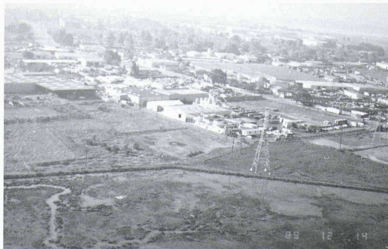
Fig. 1. — Vue aérienne du site: au premier plan, on observe la zone de marécages protégés. Au deuxième plan, on trouve deux terrains de forme rectangulaire (à gauche et à droite de l'usine), pollués par de l'arsenic.

Après de longues négociations avec les agences compétentes, il fut convenu que les sols présentant des concentrations en arsenic supérieures à 5000 mg/kg devraient être évacués vers une décharge appropriée, alors que ceux dont les concentrations étaient comprises entre 500 mg/kg et 5000 mg/kg seraient traités sur place dans le cadre des travaux décrits.