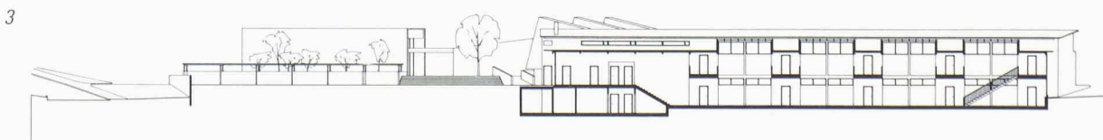
3 Coupe longitudinale