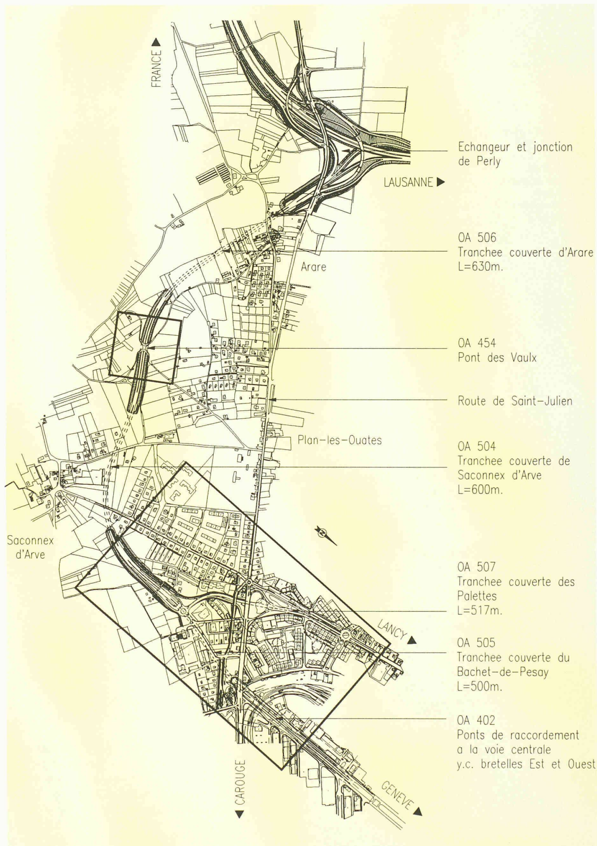
Fig. 1. – Evitement de Plan-les-Ouates: situation

compléments, a donné un avis favorable sur cette étude en avril 1992. Il faut préciser que des mesures particulières d'étanchéité seront prises sur ce tronçon au niveau de la chaussée, afin de ne pas porter préjudice à la zone qui est en contact avec les allu-