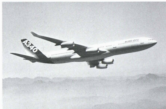
Le nouveau best-seller du constructeur européen Airbus Industrie: l'Airbus A340-200 (ci-dessus). Ce long-courrier peut transporter 262 passagers sur 14 400 km. Aperçu de la cabine de première classe (ci-dessous). Les chaînes de fabrication allemandes se trouvent à Brême et à Hambourg.

C'est toujours avec un très grand plaisir que nous prenons connaissance des remarques, des suggestions ou des critiques que nous adressent nos lecteurs. Si nous nous efforçons d'en tenir compte, il nous est malheureusement diffi-