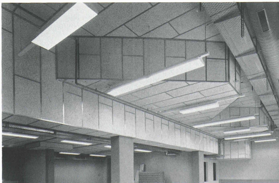
A exigences accrues, produits nouveaux.

Service technique du secrétariat général de la SIA