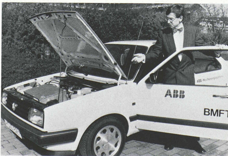
Récemment présentée à Bonn, la nouvelle voiture électrique peut atteindre 120 km/h et elle a une autonomie de plus de 150 km sur route.

non polluante parce que sans gaz d'échappement, roulera à l'énergie