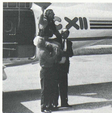
Joie après un premier vol réussi.

Quand le PC-12 se pose après quarante-deux minutes, le soulagement et la joie se manifestent : un jalon capital dans le développement du nouvel avion est atteint. La traditionnelle fête de circonstance peut commencer.