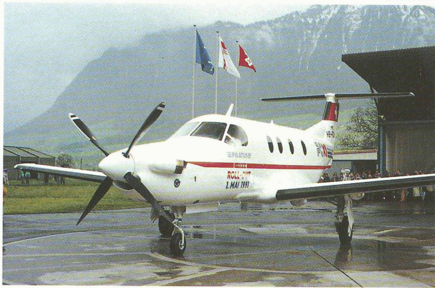
1 er mai 1991: «Roll out» du Pilatus PC-12.

pilote automatique sur les trois axes, un radar météorologique et un système de navigation LORAN (Long range). Les dimensions généreuses du tableau de bord laissent d'amples réserves d'espace pour compléter cet équipement. Les systèmes électriques et de gestion du carburant sont au moins entièrement doublés, pour assurer la plus grande fiabilité.