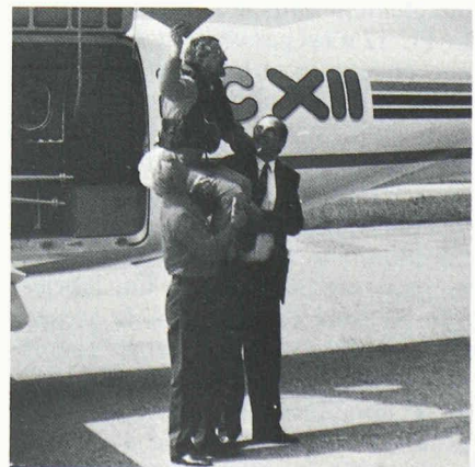
Joie après un premier vol réussi.

Quand le PC-12 se pose après quarante-deux minutes, le soulagement et la joie se manifestent : un jalon capital dans le développement du nouvel avion est atteint. La traditionnelle fête de circonstance peut commencer.