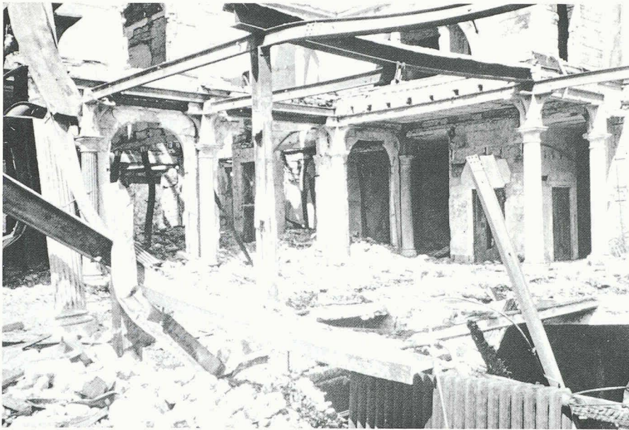
Les incendies violents endommagent souvent gravement le système porteur. Avec le compartimentage coupe-feu, on essaie de limiter les dégâts.

de la procédure, la police du feu est aussi consultée; elle applique en général les mêmes règles que pour les nouvelles constructions.