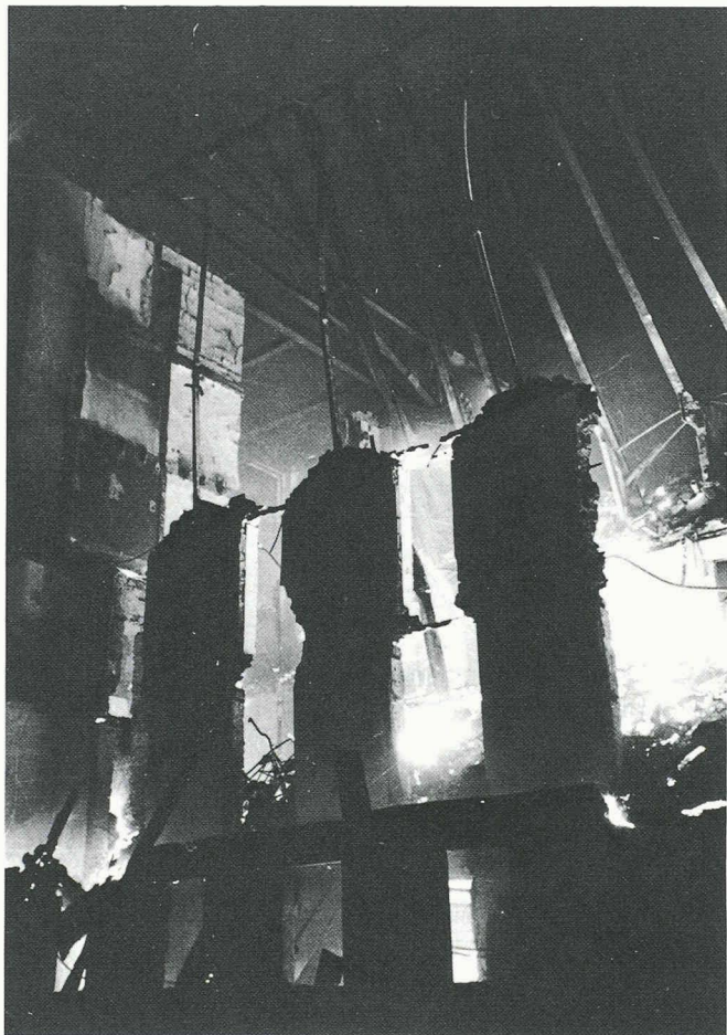
Plus de 20 000 incendies surviennent chaque année en Suisse. Bilan : 20 à 50 morts et des dégâts matériels dépassant le demi-milliard.