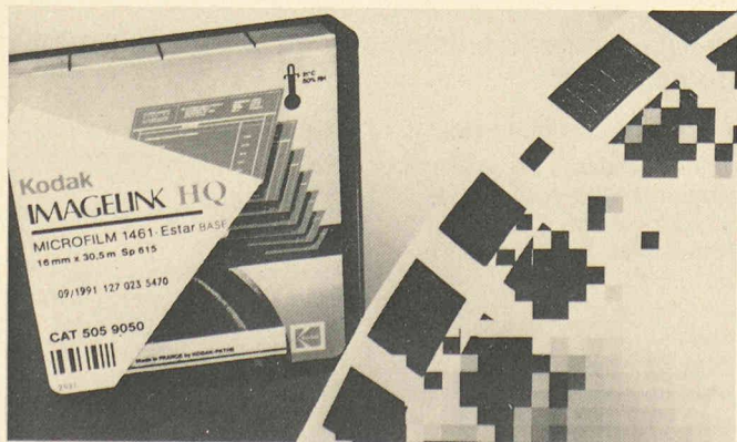
Microfilm Imagelink High Quality, une nouvelle génération de microfilms pour une saisie rapide et sûre des documents.

WEMO Technique frigorifique 8252 Schlatt/TG Tél. 053/37 38 21 Fax 053/37 39 40