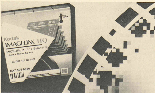
Microfilm Imagelink High Quality, une nouvelle génération de microfilms pour une saisie rapide et sûre des documents.

WEMO Technique frigorifique 8252 Schlatt/TG Tél. 053/37 38 21 Fax 053/37 39 40