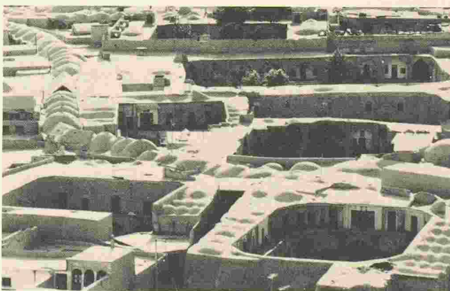
Isfahan, Iran: le Grand Bazar à la recherche de son chemin à travers les caravansérails, les mosquées et la structure urbaine.

Heures d'ouverture: du lundi au vendredi de 8 à 19 heures.