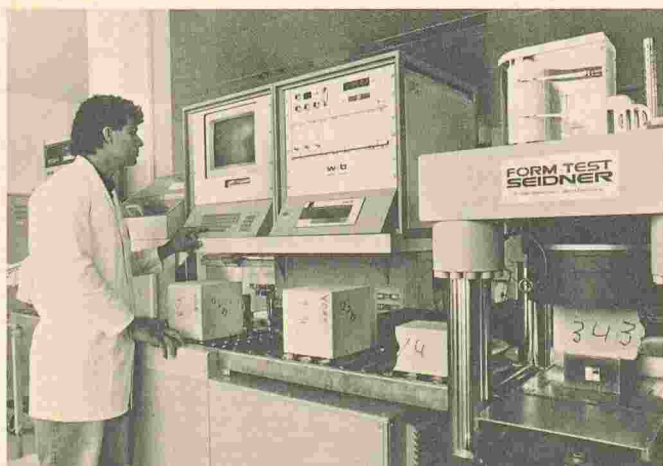
Le nouveau centre MBT de Zurich-Schlieren. Ici, le laboratoire du béton.

Bosch commencera cet été à produire les premiers réfrigérateurs et congélateurs avec mousse sans hydrocarbures chlorofluorés, dans son usine de Giengen/Brenz (RFA).