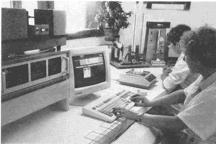
Fig. 1. - Vue d'ensemble de l'installation.