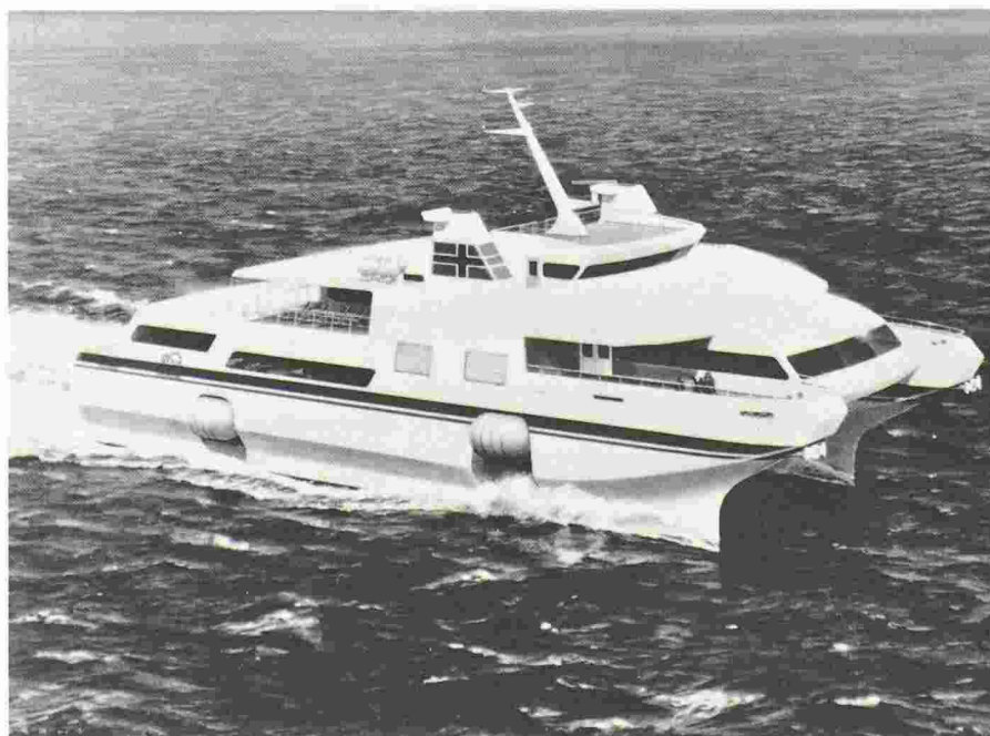
Le «bac de demain» sur coussin d'air.

Autre constructeur et autre mode de propulsion aquatique, la Motoren- und Turbinen-Union de Friedrichshafen, qui appartient au groupe Daimler-