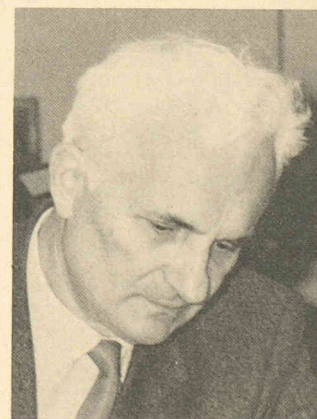
M. Jacques-Louis Lions.

de lire ses contributions dans nos colonnes.