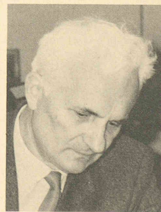
M. Jacques-Louis Lions.