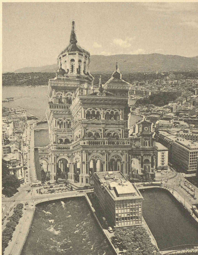
Fig. 1. – «L'année 1985 sera-t-elle celle de la réinvention de la ville?» – Collage d'un ami.

Pour l'Ile, les architectes mandatés, avec leur solide respect professionnel, n'ont pu, après de longues cogitations et un pénible parcours de consultation, aller au-delà d'un «honnête» projet d'«alignement réglementaire» 1 . En regardant attentivement l'ensemble qui se construit à l'heure actuelle, on