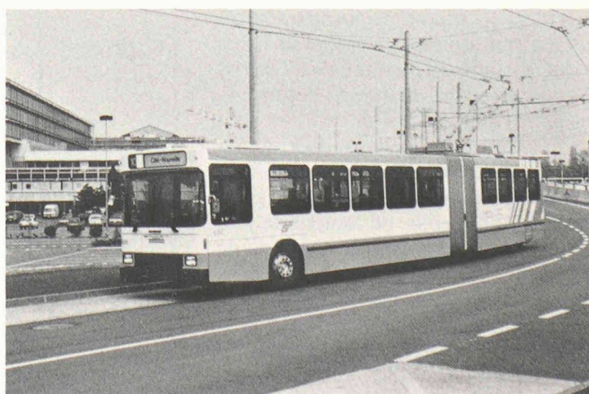
Nouveau trolleybus articulé NAW.