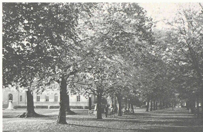
Les Bastions: allée de marronniers (Aesculus hippocastanum) située dans le premier jardin botanique créé en 1816 par Augustin Pyrame de Candolle.

Les illustrations d'arbres ont été mises à disposition par le Service des espaces verts et de l'environnement de la Ville de Genève qui a fêté les 125 ans de sa création en 1988. Plus connu sous le nom de SEVE – sigle sympathique et chlorophyllien –, ce service, déjà réputé sous son ancienne appellation de Parcs et promenades, a largement contribué à faire de Genève la cité des parcs.