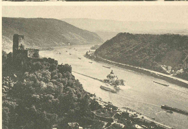
Deux aspects de la Rhénanie: zone industrielle de Leverkusen, avec le complexe chimique Bayer (en haut) et le site romantique du Rhin près de Kaub, avec le château de Gutenfels et l'ancien péage du château de la «Pfalz», au milieu du fleuve, avec son donjon à cinq pans cerclé d'une enceinte à tourelles.