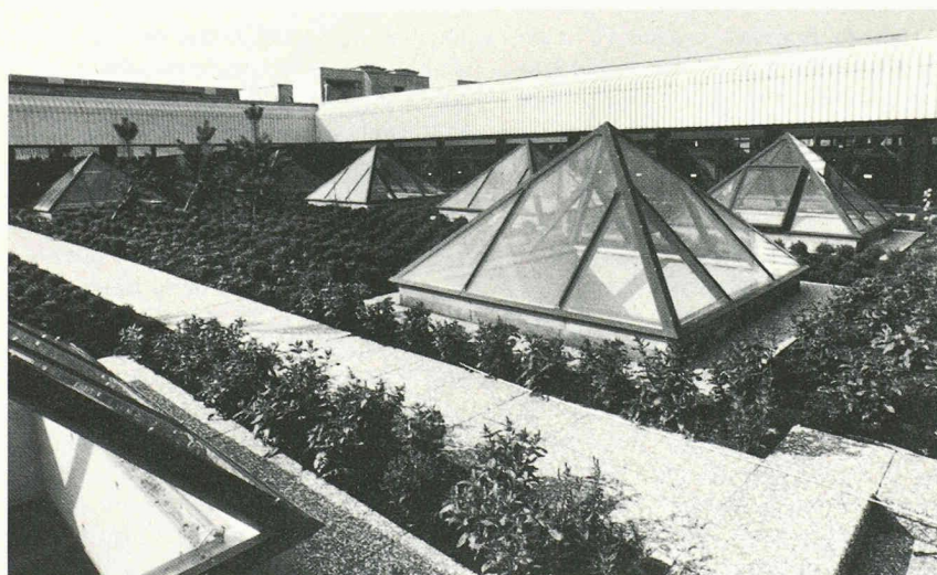
Coupe à travers un jardin de toiture entièrement équipé.

La question du but et de l'utilité d'un jardin de toiture mérite d'être posée. Il est clair que, dans une certaine mesure, le renouveau même de l'idée, stimulé par les développements de la technique, résulte de la pression de l'opinion publique pour un cadre de vie plus naturel, plus agréable à l'individu, moins artificiel.