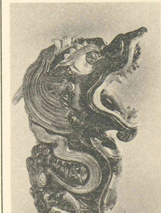
Dragon porte-bonheur de l'époque Ming, symbolisant la prospérité et la fertilité. Il est impossible de le dater: plus le visage s'humanise, plus il est récent.