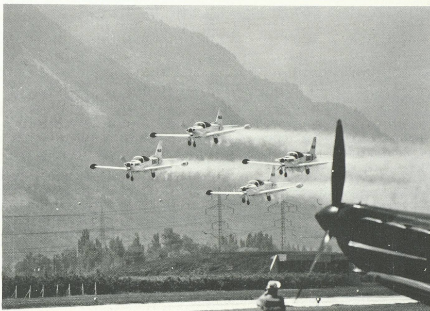
Le spectacle : les SIAI-Marchetti SF-260 de la patrouille des Alpi Eagles italiens.

Faut-il mentionner que c'est l'avion qui a permis l'épanouissement de la vocation internationale de la Suisse, en lui ouvrant une porte nouvelle sur les cinq continents ?