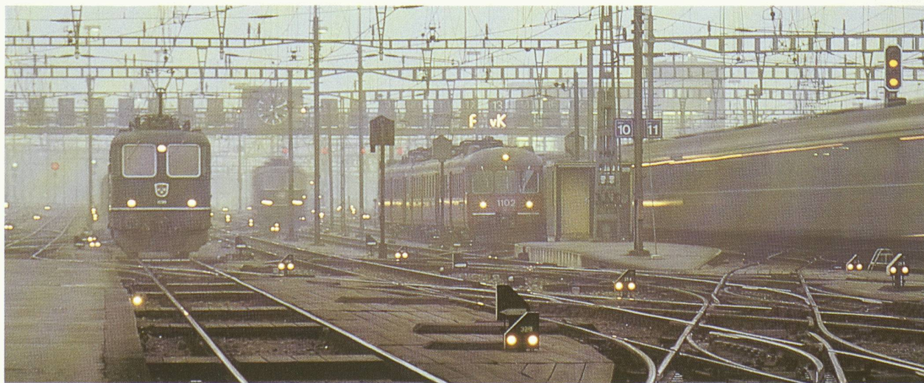
40 % d'électricité en moins ? Pas de développement des transports publics !

Il est parfaitement odieux d'entendre systématiquement toutes les personnes ou institutions touchant à la production d'électricité accusées sans appel de four-