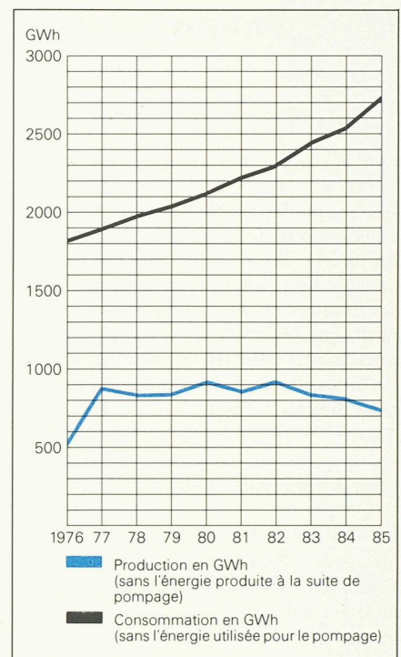
Vaud, un ferme bastion contre l'énergie nucléaire ? Les statistiques de production et de consommation d'électricité y indiquent plutôt une totale indifférence sinon l'incohérence !

Notre civilisation des loisirs privilégie la fête . Les édiles des localités grandes et petites s'efforcent de promouvoir des festivités sous les égides les plus diverses, avec un succès (notamment financier) également fort variable. Ces efforts touchent parfois au pathétique : la célébration du 1 er août en est un exemple, qui fait douter d'aucuns que le sentiment patriotique existe encore. Pour l'amour du ciel,