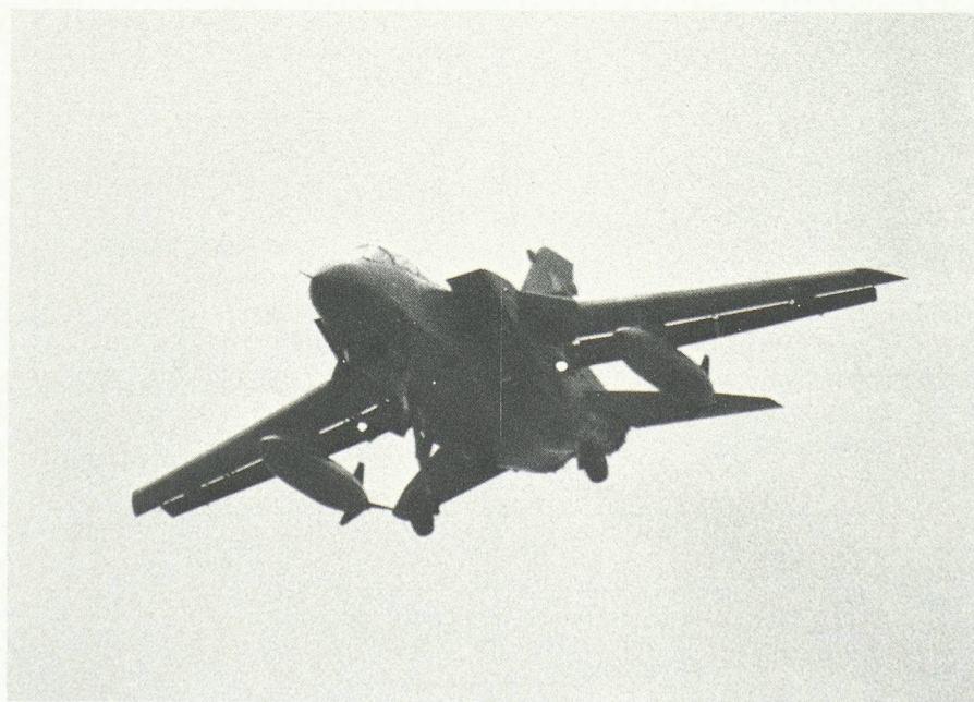
La technique européenne la plus moderne : le Panavia Tornado.

On a souvent parlé, à propos d'une certaine inspiration écologique, de la dictature d'une minorité. Heureusement que la foule venue à Sion, comme elle est venue ces années dernières à des meetings aériens à Bex, à Neuchâtel, Ecuvillens ou Lausanne, — pour rester en Suisse romande — a montré le sort qu'elle réservait à de telles perspectives. Ceux qui ont vécu de telles fêtes ont ressenti que la technique fait bel et bien partie de notre civilisation et de l'existence de chacun de nous. Certes, il existe des valeurs plus élevées que les joies et les agréments apportés par la technique, mais le bonheur ne réside pas dans une conception rétrograde de la vie. Le XX e siècle, avec ses techniques de pointe, nous offre des fêtes au moins aussi exaltantes que le Moyen Age, en plus d'un bien-être quotidien que nous aurions mauvaise grâce à mésestimer.