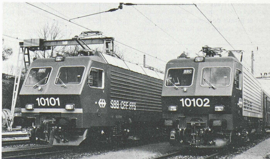
Les CFF demain : investissements concentrés sur les NTF (voir IAS n° 5/1984), innovation technique ralentie : les Re 4/4 IV resteront quatre, sans qu'une nouvelle génération soit en vue.