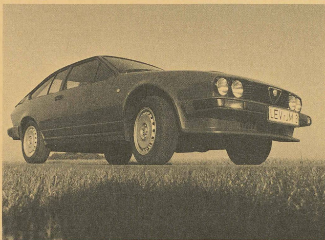
Par l'utilisation de 35 kg de polyuréthane, l'Alfa Romeo présente une résistance améliorée aux assauts du temps ainsi qu'une diminution de poids non négligeable.

bouillage du tableau de bord, les accoudoirs, les appuie-tête ou le pommeau du levier de vitesse ou le rembourrage des sièges, dans le cas de l'Alfa Romeo GTV. Ce modèle étant conçu pour durer, il convient de fabriquer le plus grand nombre possible d'éléments en matière ne nécessitant pas d'entretien et insensible aux chocs, aux intempéries et à la corrosion. Ces conditions sont remplies par le Bayflex® de Bayer. Son utilisation conduit de plus à une réduction de poids notable par rapport aux matériaux usuels, de sorte qu'à puissance égale la consommation d'essence en est diminuée. Alors que les éléments extérieurs doivent résister tant aux chocs qu'aux intempéries, les pièces intérieures ont pour rôle de protéger les occupants contre les conséquences d'accidents éventuels, donc d'amortir les impacts. L'amortissement des vibrations et une faible transmission est une caractéristique supplémentaire bienvenue.