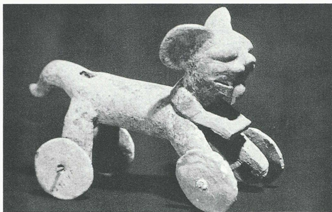
La roue: jouet seulement? Jaguar monté sur roulette, long de 18 cm, trouvé à Nopiloa (Etat de Veracruz), près de la côte du golfe du Mexique.

sites grandioses, aujourd'hui déserts, que nous montre l'auteur. On évoque le fourmillement bigarré qui devait les animer et l'on aimerait tant renverser le cours de l'Histoire pour éviter l'agonie de ces peuples, auquel ne nous relie aucune tradition, certes, mais qui ne nous en fascinent pas moins par leurs témoignages muets.