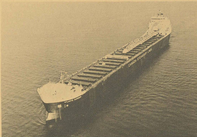
Le M/S «Atlantic Superior» propulsé par un moteur diesel Sulzer 6RLA66.

Des communications originales, à caractère didactique ou spécialisé, sont sollicitées dans les domaines mentionnés plus haut. Les auteurs intéressés sont priés de soumettre un texte complet (exposé didactique) ou un résumé très détaillé (exposé spécialisé), jusqu'au 15 mars, 1984 au Comité scientifique des Journées d'électronique, EPFL, chemin de Bellerive 16, 1007 Lausanne, qui donne également toute information complémentaire.