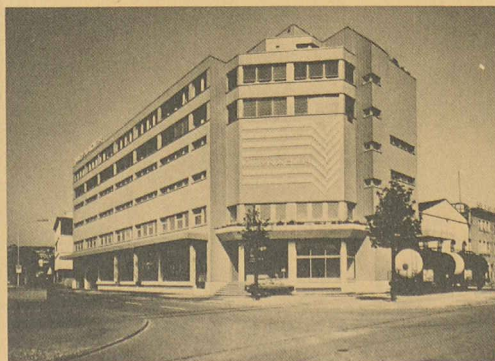
Meynadier: hier et aujourd'hui.