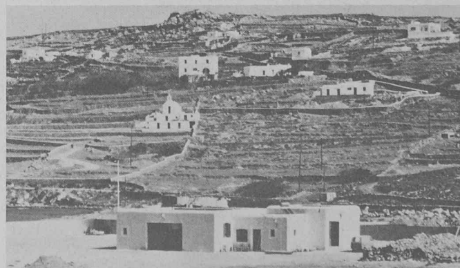
Ce bâtiment a été conçu pour s'intégrer dans l'architecture locale de l'île grecque de Mykonos. Il abrite la première installation importante de dessalement de l'eau de mer par osmose inverse qui ait été montée en Grèce et qui produit quotidiennement 500 000 litres d'eau douce.

mettent de produire de l'eau pure à partir d'eau de mer en une seule opération.