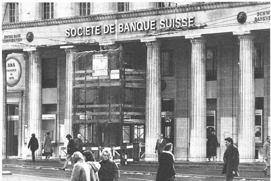
Banque et construction: nécessaire dialogue.