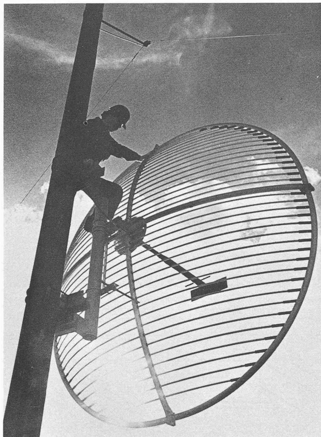
Montage d'une antenne sur pylône, destinée à la liaison radiophonique par canaux multiples.

lement par BBC. Un système de téléaction, d'éclairage des pylônes et de protection cathodique du gazoduc complète cet équipement. Afin d'assurer la fourniture du courant électrique en cas de défaillance d'alimentation, toutes les stations sont équipées de batteries.