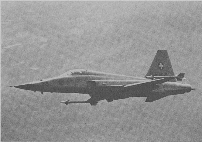
Un F-5E Tiger suisse; cet avion est soumis à de fréquentes sollicitations dynamiques lors de son utilisation dans notre relief.

Dans notre pays, le comportement à la fatigue des cellules d'avions fait l'objet d'études et de recherches très poussées (Rédaction).