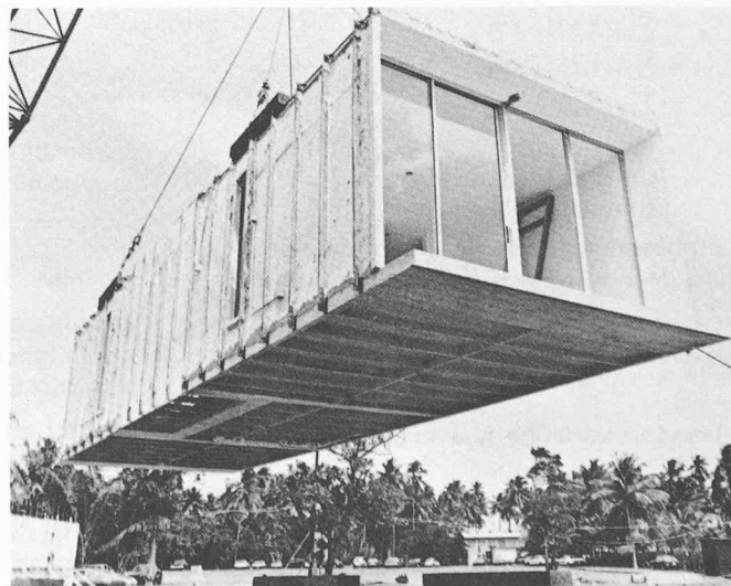
Fig. 7. — Module de 40 m 2 bétonné.