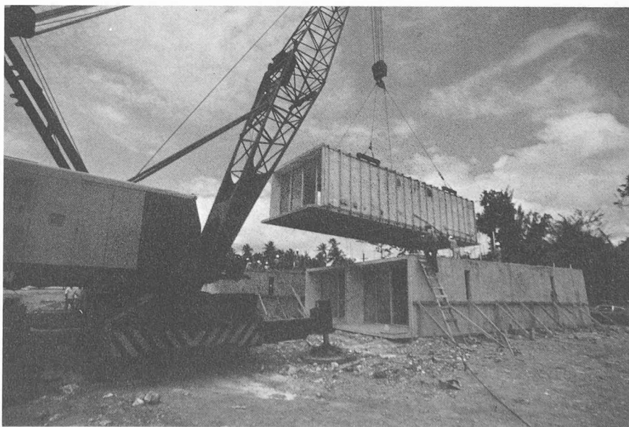
Fig. 1. — Mise en place des modules.

Le levage du plancher et du plafond est réalisé au moyen d'un palonnier rectan-