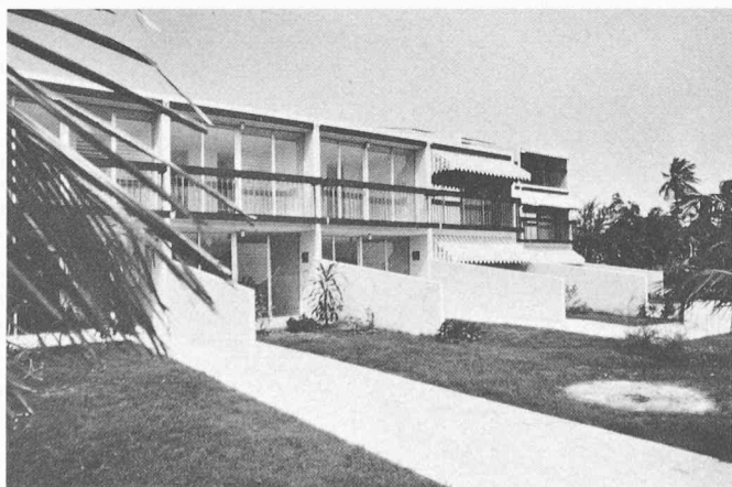
Fig. 3. — Logements semi-collectifs à Porto Rico.