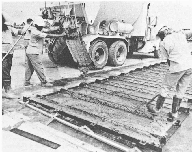
Fig. 6. — Panneau en cours de bétonnage.