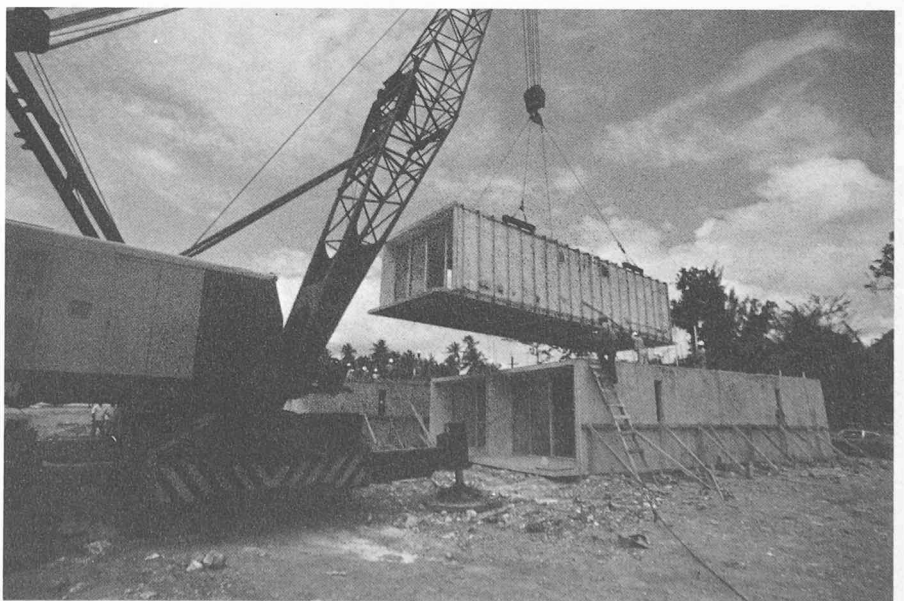
Fig. 1. — Mise en place des modules.

Le levage du plancher et du plafond est réalisé au moyen d'un palonnier rectan-