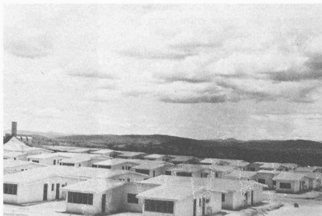
Fig. 4. — Logements individuels au Brésil.