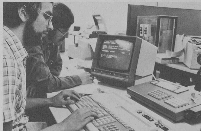
Système de saisie de données machines MDE: terminal de saisie, calculateur et console de visualisation au cours du test système.

Les terminaux de saisie 3803 des systèmes Siemens 300, développés à cet effet, sont des appareils portatifs au format