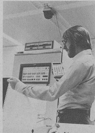
Système d'assurance qualité QSIS: terminal portatif à infrarouges avec clavier et affichage alphanumérique en cours de test en liaison avec la station relais fixe et le calculateur industriel R 30 des systèmes Siemens 300.