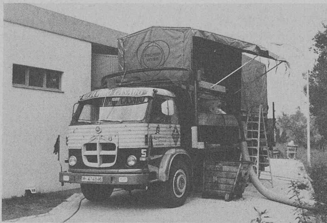
Fig. 1. — Installation pilote mobile de déshydratation de boues prête à fonctionner dans une entreprise industrielle.

La gamme des études va des eaux usées spéciales de l'industrie (fabrication de papier, traitement des vieux papiers, épuration de saumure) jusqu'aux eaux usées communales dans les zones résidentielles. L'installation pilote mobile a pour but d'obtenir directement sur place des résultats pour la conception de grandes installations fiables. Les boues biologiquement actives provenant des installations d'épuration des eaux usées communales, en particulier, doivent être absolument traitées dans la