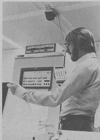
Système d'assurance qualité QSIS: terminal portatif à infrarouges avec clavier et affichage alphanumérique en cours de test en liaison avec la station relais fixe et le calculateur industriel R 30 des systèmes Siemens 300.