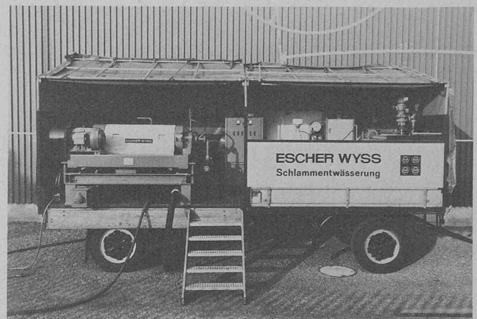
Fig. 2. — Installation pilote mobile pour l'étude des boues d'eaux usées en service en Espagne.

A l'aide de l'installation pilote mobile d'Escher Wyss, il est possible de trouver à peu de frais la solution la plus avantageuse économiquement pour chaque cas spécifique. Le concept d'étude a déjà fait ses preuves lors d'applications dans divers pays européens.